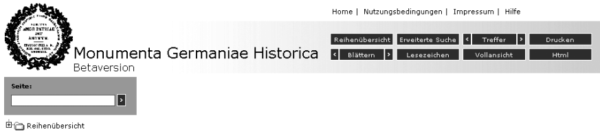
Abbildung 3: Funktionselemente der Beta-Version

Arbeit der auswertenden Forscher möglich. Und nur so kann der Benutzer auch ungefähr die Qualität der Abschrift kontrollieren. Eine Vorstellung von der Fehlerfreiheit des Textes ist aber wiederum unerlässlich, um die Belastbarkeit der Suchergebnisse einschätzen zu können.